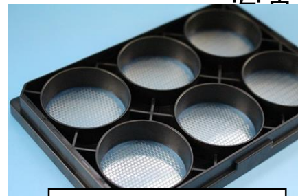
細胞培養プレート